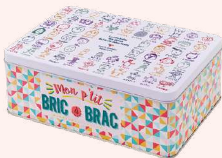
BRIC À BRAC