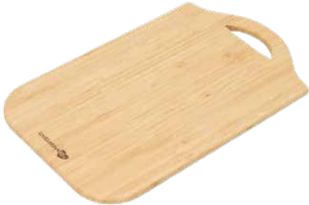
Planche à découper en bambou