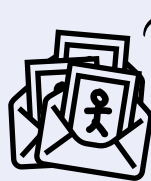
les enveloppes à dessins + feuilles à dessiner