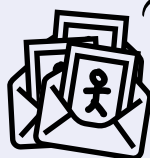
les enveloppes à dessins + feuilles à dessiner