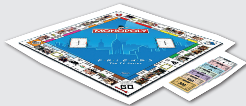
Jeu Monopoly Friends